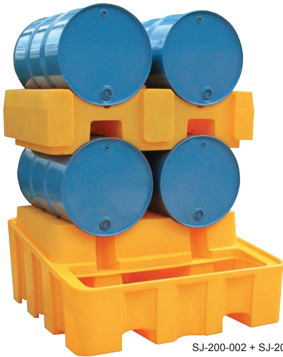
SJ-200-002 + SJ-200-003